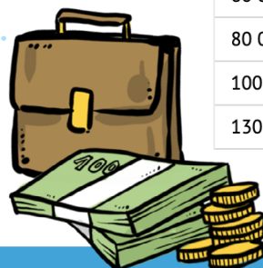
Efekt navrhovaných opatření na výpočet čisté mzdy